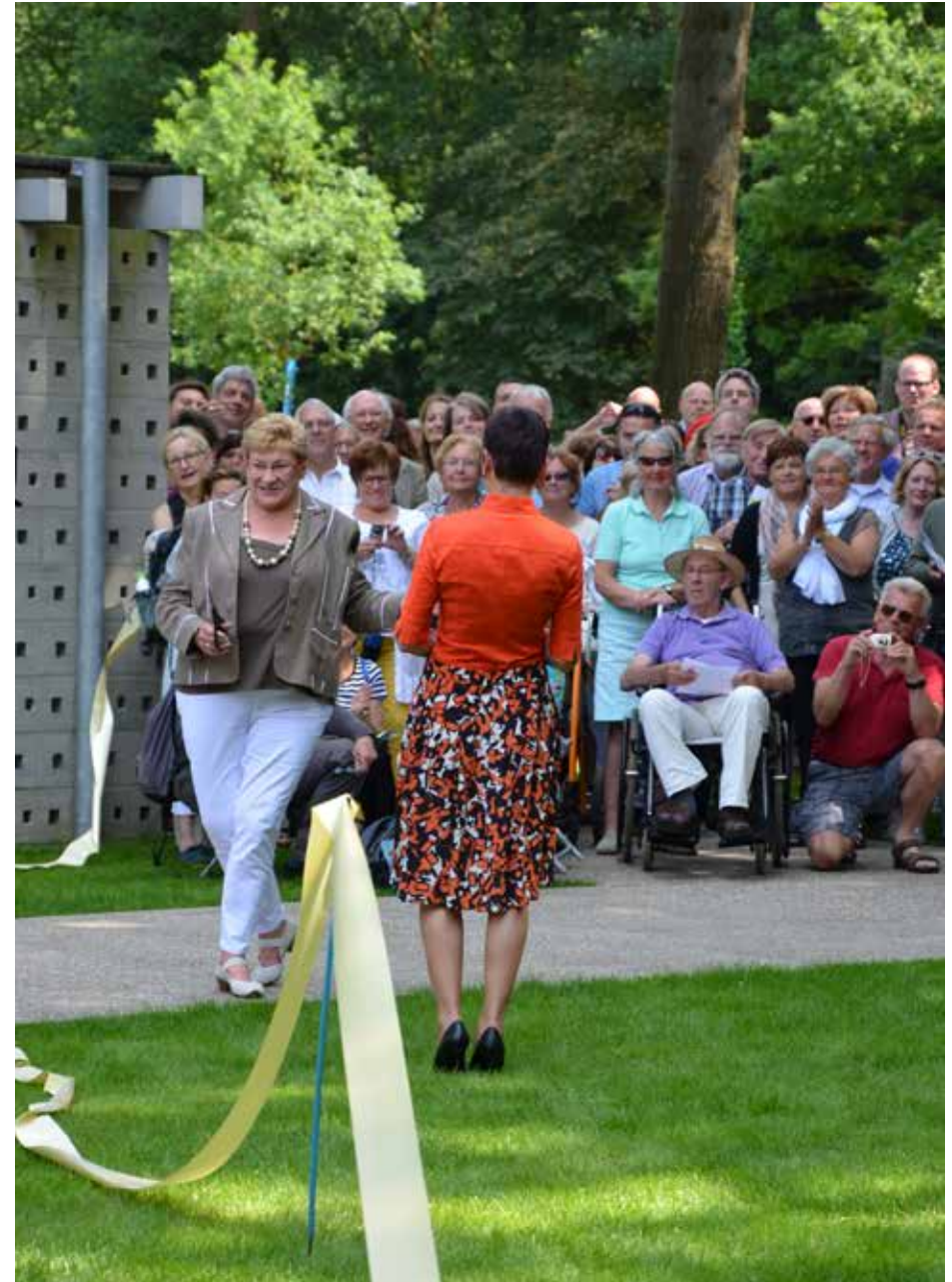
Start van het jubileumjaar en opening van de tentoonstelling Top 75