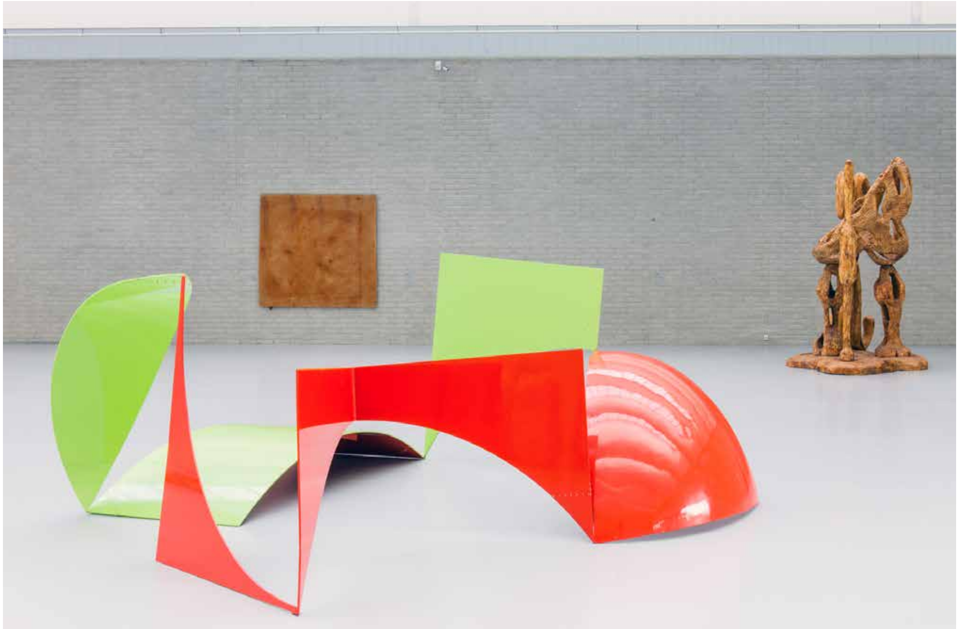
Tentoonstelling A One Day Walk