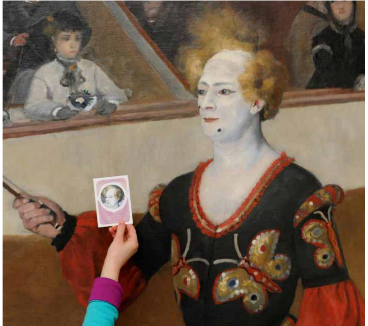
Speurspel: Auguste Renoir, Le clown musical , 1868

Op 1 januari 2012 is het museum toegetreden tot de Museumkaart voor een proefperiode van twee jaar. Het museum ziet de kaart als een belangrijk instrument om meer Nederlandse bezoekers te trekken. In 2012 ontvangt het museum 71.992 bezoekers met een Museumkaart, in 2013 zijn dit er 83.596, wat neerkomt op 25% van het totale aantal bezoeken. De conclusie is dat de meerwaarde van de Museumkaart zich in de afgelopen twee jaar heeft bewezen en dat de samenwerking wordt voortgezet.