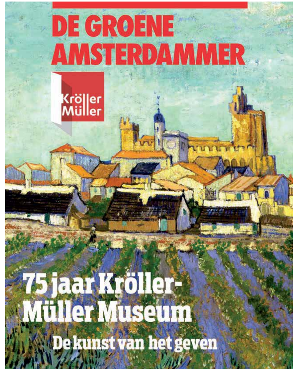
Speciale jubileumbijlage in De Groene Amsterdammer

Zij kunnen Gulden Boeker, Zilveren Boeker of Bronzen Boeker worden, door eenmalig of vijf jaar lang jaarlijks een bedrag aan het Helene Kröller-Müller Fonds te schenken. ABN AMRO Bank is samen met het Kröller-Müller Museum founding partner. Founding partners dragen bij aan de startkosten van het Fonds. Een vijftien leden tellend Comité van Aanbeveling helpt actief mee met de werving van boekers. Ultimo december 2013 zijn er elf boekers geworven en hebben zes