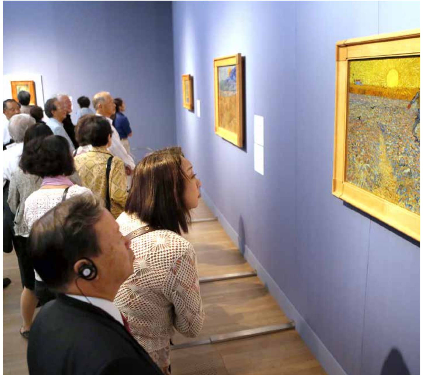
Tentoonstelling Divisionism. From Seurat to Van Gogh and Mondrian in Japan

In 2013 vinden twee presentaties in het buitenland plaats met werk uit de collectie. Tot 17 maart toont de Pina-cothèque de Paris onder de titel Van Gogh. Rêves de Japon dertig werken van Vincent van Gogh uit de Kröller-Müller collectie. Ongeveer 100.000 bezoekers bezoeken deze tentoonstelling in 2013. In Japan gaat op 3 oktober in het National Arts Centre in Tokyo de tentoonstelling Divisionism. From Seurat to Van Gogh and Mondrian van start. Deze tentoonstelling bestaat voornamelijk uit werken uit de collectie van het Kröller-Müller Museum, zowel schilderijen (zevenenvijftig) als werken op papier (zeventien), aangevuld met enkele schilderijen uit Japanse collecties. De tentoonstelling duurt tot 23 december en trekt 182.477 bezoekers. Daarna reist de tentoonstelling door naar twee andere locaties in Japan.