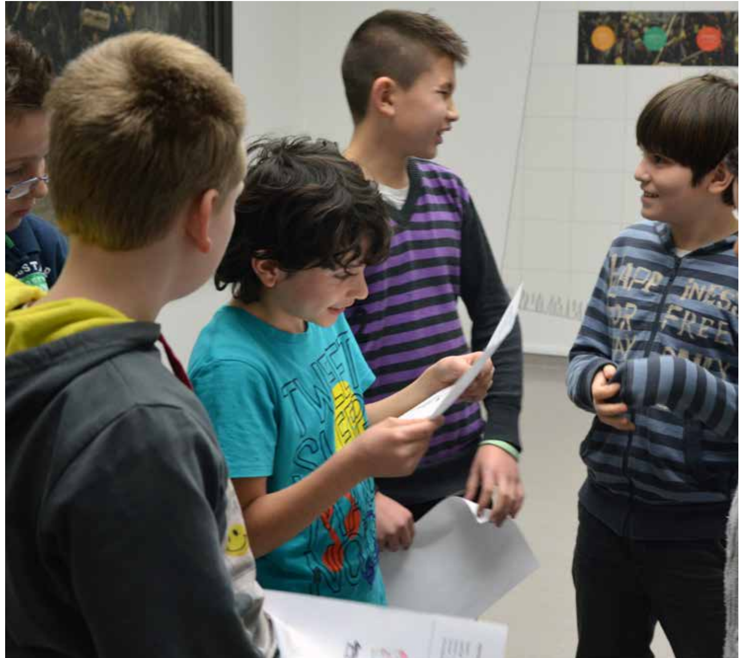
Scholieren aan het werk in de tentoonstelling 10 Topstukken 1001 Verhalen

Het museum verzorgt ook dit jaar weer verschillende workshops en lezingen over de actuele mogelijkheden van kunsteducatie, voor Pabo's, leerkrachten en ICC-ers.