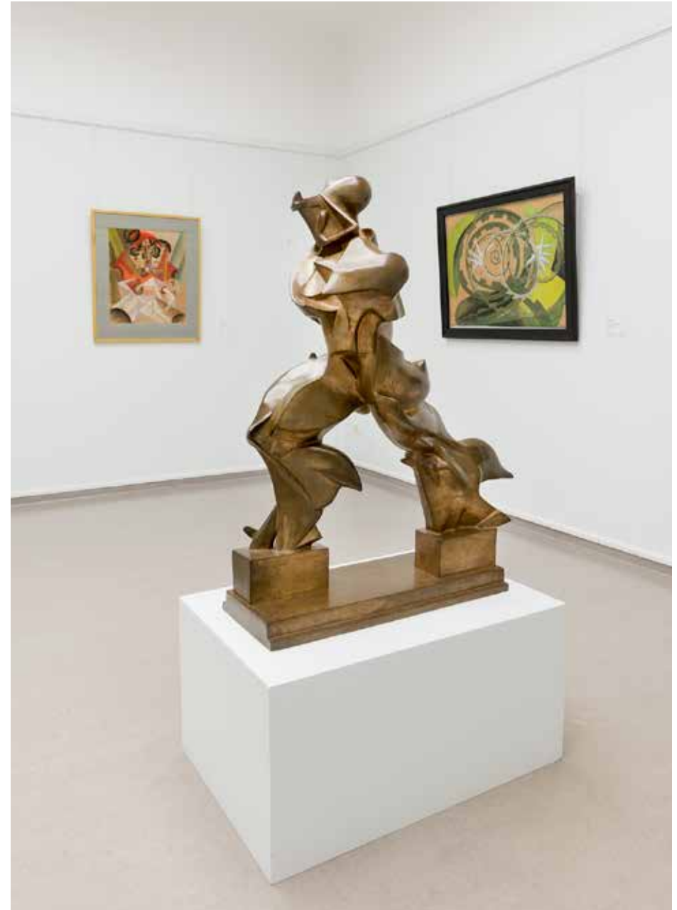
Forme rumore di motocicletta van Giacomo Balla in de nieuwe futuristenpresentatie

In het kader van het supporterschap van het Krölller-Müller Museum levert de Gemeente Ede bijdragen in de vorm van locatiehuur, afname van entreekaarten en het ontwikkelen van educatieve projecten. Daarnaast draagt de gemeente € 10.000 (inclusief BTW) bij aan de Zwoele Zomeravonden.