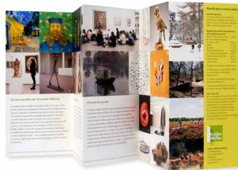
Algemene folder, ontworpen in de nieuwe huisstijl