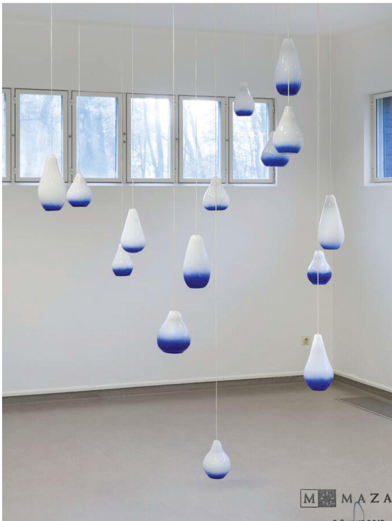
Song for three rooms van Maria Barnas