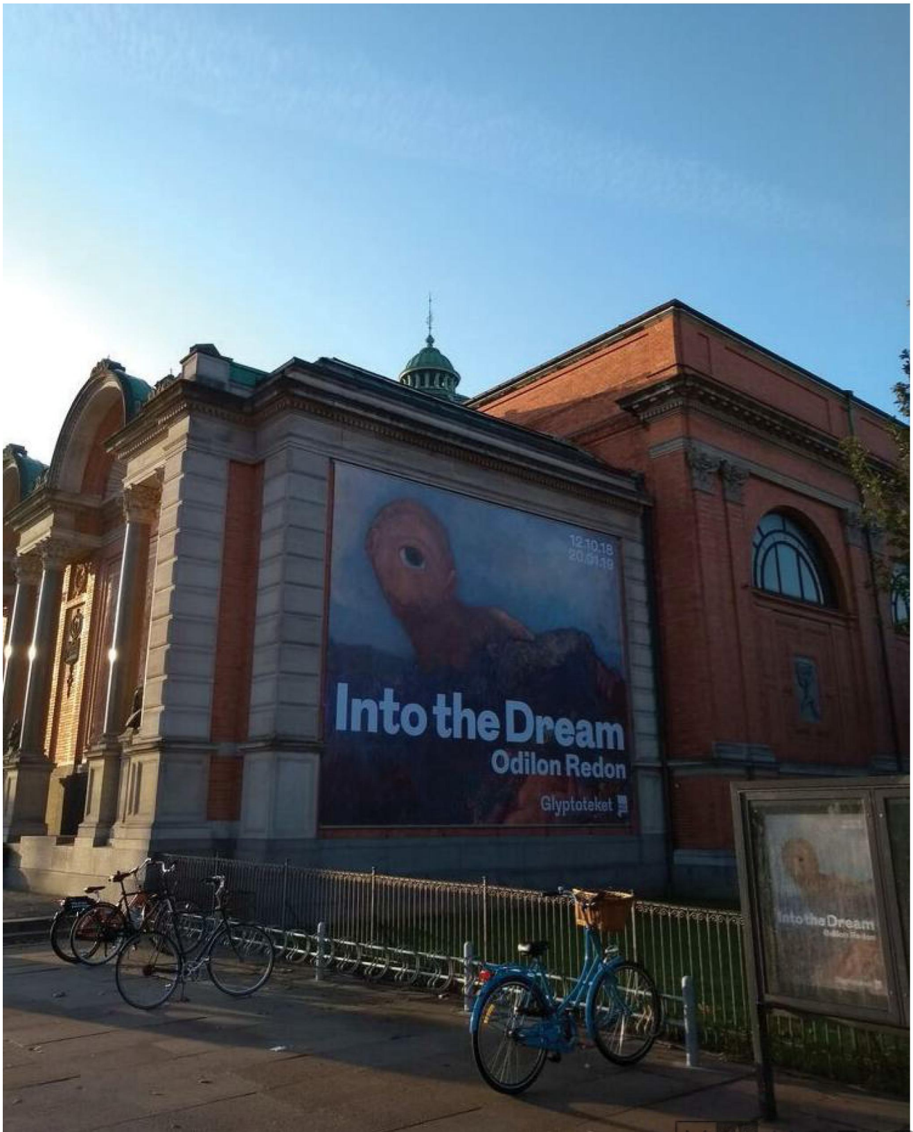
Redontentoonstelling in de NY Carlsberg Glyptotek in Kopenhagen