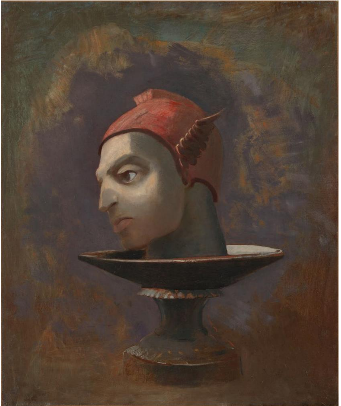
Odilon Redon, Tête de Persée , circa 1875