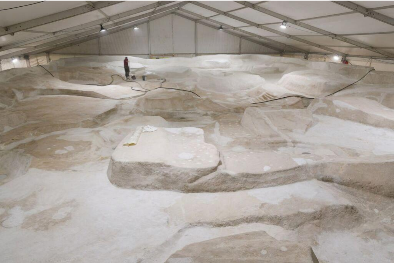
Restauratie van Jardin d'Émail in een werktent