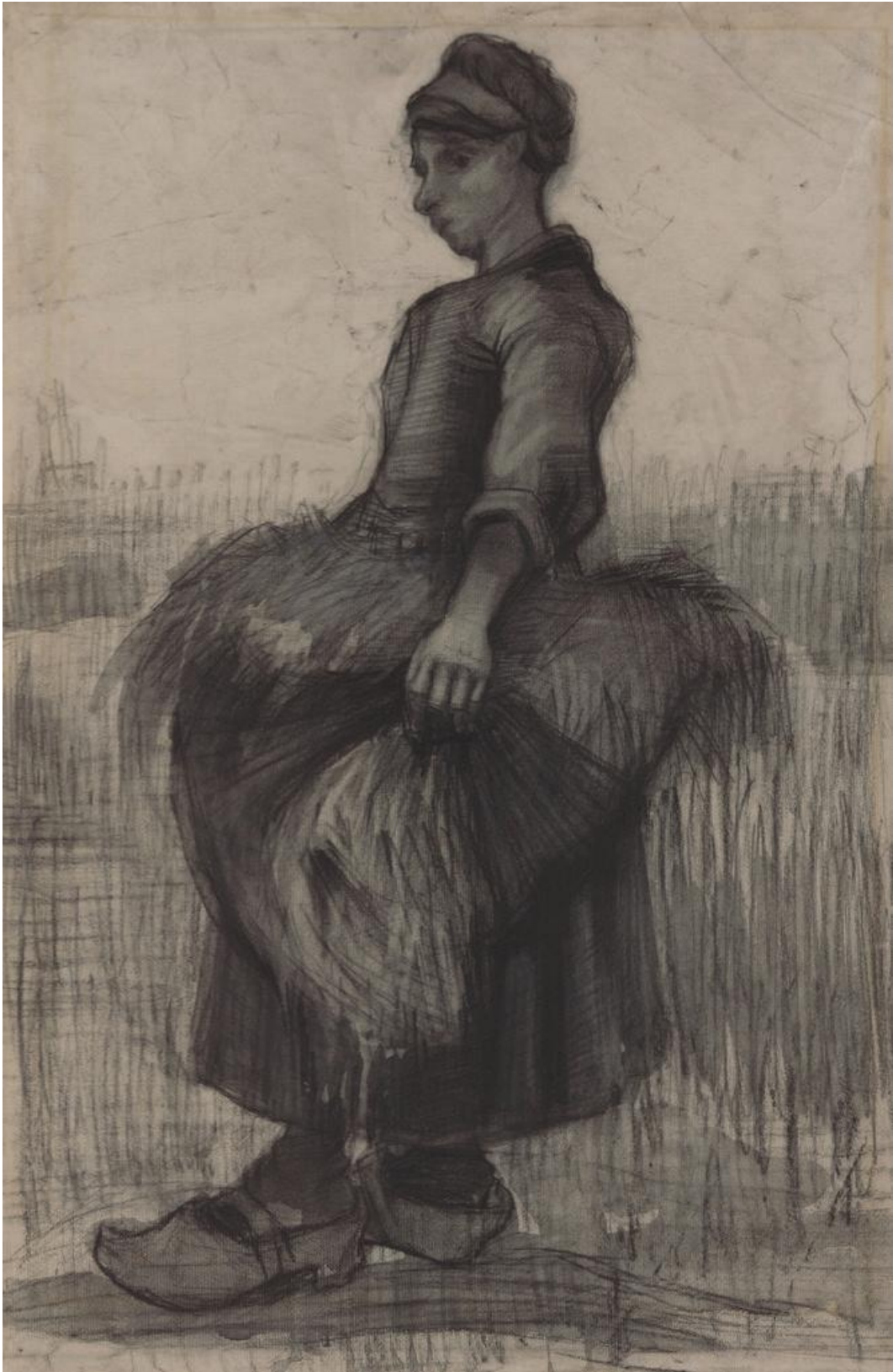
Vincent van Gogh, Boerin met koren in haar schort , 1885