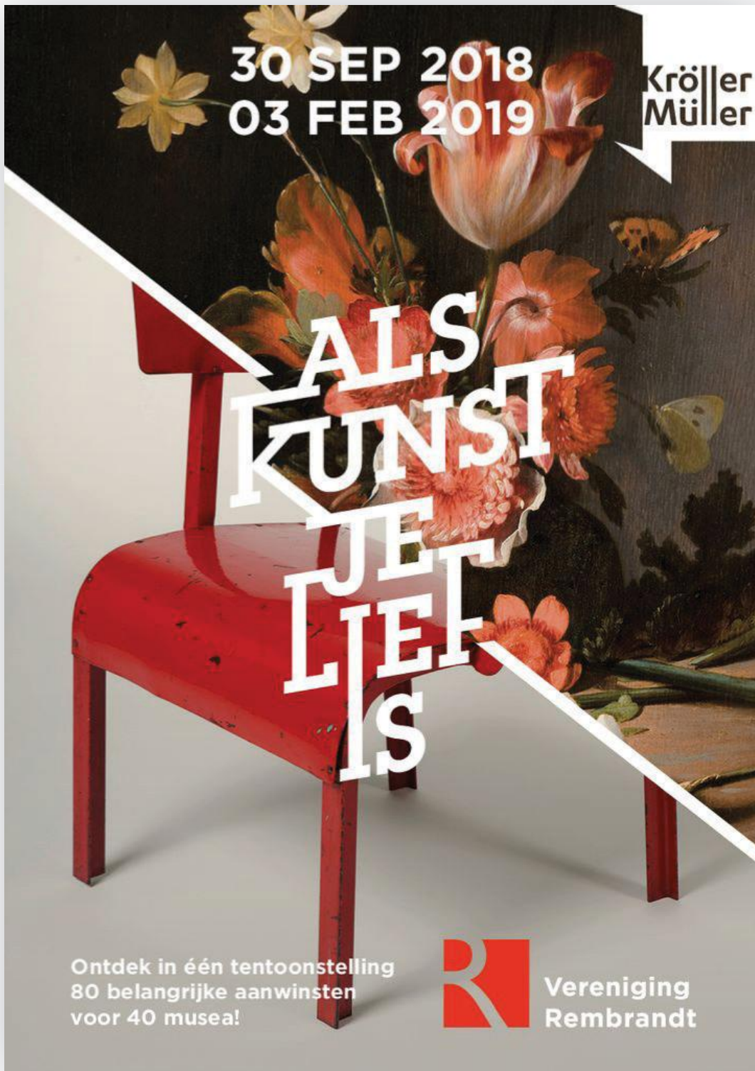
Campagnebeeld Als kunst je lief is