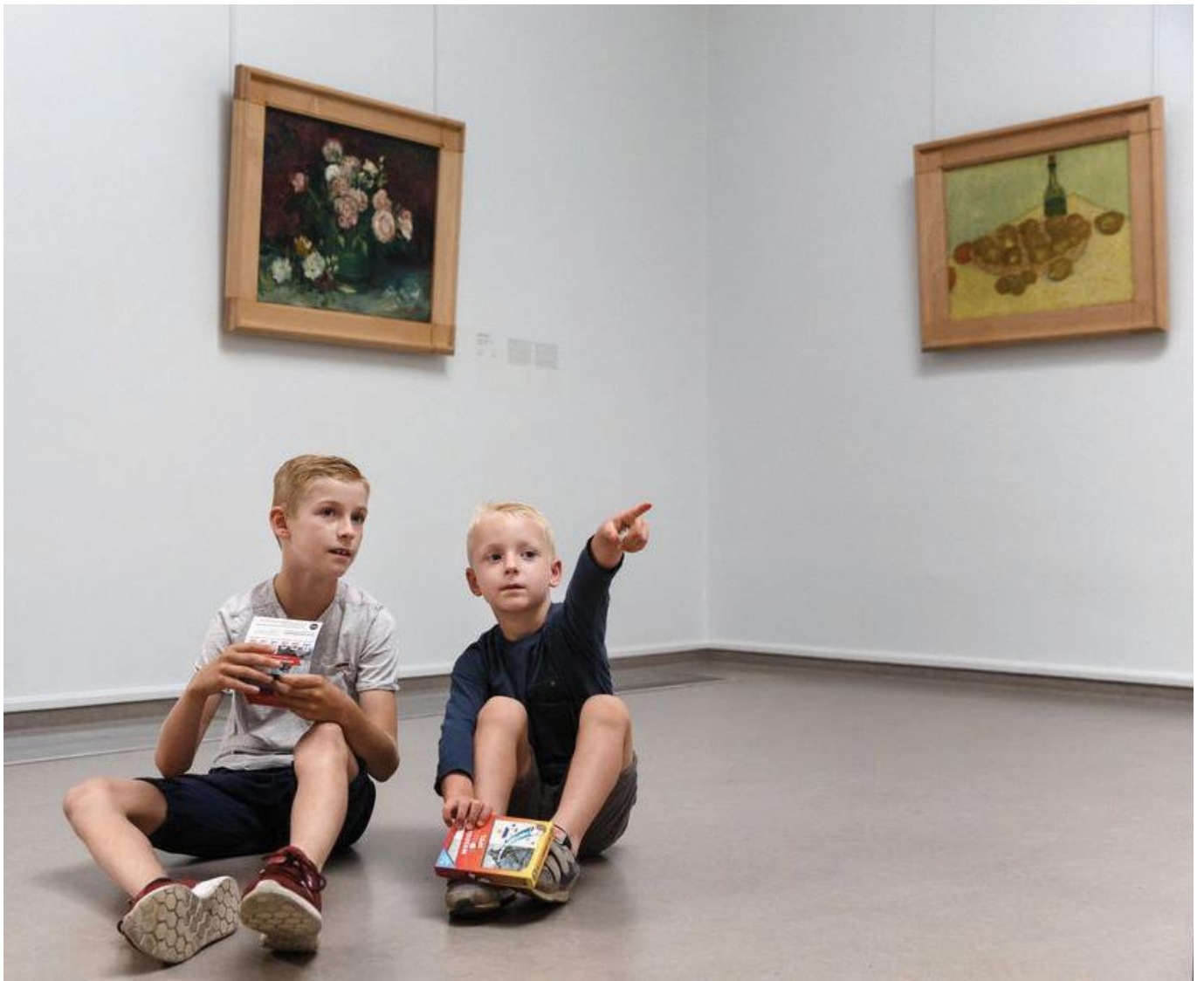
Kinderen met het Museumdobbelspel