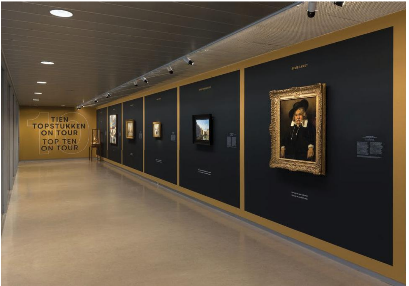
Tien topstukken on tour in het Kröller-Müller Museum