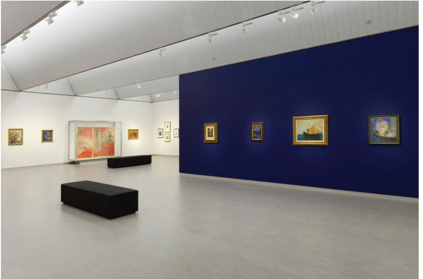
Tentoonstelling Odilon Redon. La littérature et la musique